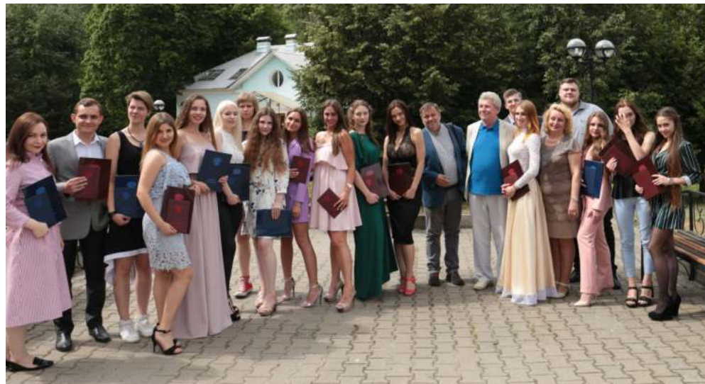
На фото: первый выпуск кафедры 2018 года.